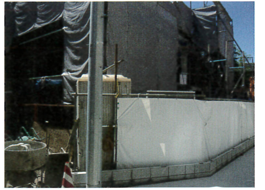
完成間近の新ワルツの様子