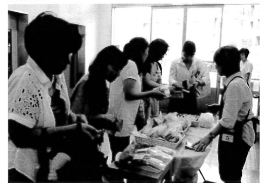
ご家族の皆様との理解を深める機会になっています。

黒本町福祉工房に隣接するさんまるしえでは、目黒区内の施設から雑貨や焼き菓子、シヨコラ等の販売をしています。日頃は店内で販売をしていますが、年に数回開催される工房の家族連絡会のご利用者様のご家族が集う機会なので、この機会をとらえて、館内のエレベーター前に仮販売スペースを確保し、簡単なミニ販売会を実施し、拡