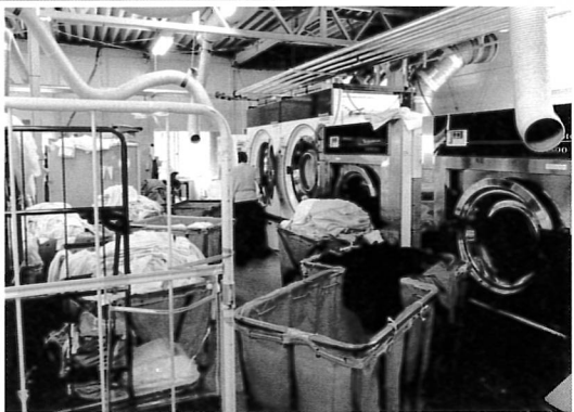
大型受注を受けられるように体制を整えています。

この4月より荻窪北マンション104を「にぎやかクリーニング」の名称でクリーニング事業を立ち上げました。引取りから納品までご利用者様の出来ることを少しずつ増やしながらの事業展開です。現在は、新宿駅周辺の限られたエリアからのスタートですが、自社ビルや管理しているビルを多数抱えている企業との提携から進めています。