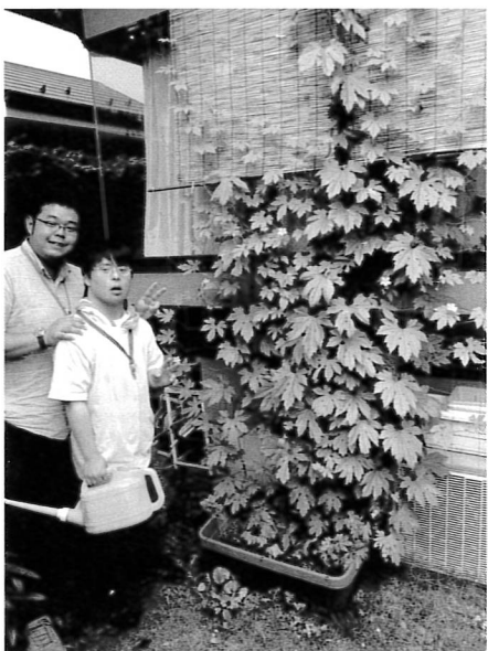
ご利用者様との絆をより深めます。

かく都会ではコミュニケーション力が欠如し、近隣との人間関係が希薄となつていると、言われています。その延長線上にあけぼの作業所とご家族様との関係が構築されているとしたら憂慮すべきことだと思っております。GH等に居住しているご利用者様には特に配慮して関係性を構築していかなければならないと思っております。勿論、ご