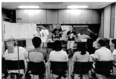
自立支援事業の音楽クラブの様子

今年4月より、杉並区では、福祉事務所の愛の手帳担当ケースワーカーの体制が無くなったこと、サービス利用の相談窓口として、区役所障害者施策課（1階）や地域ネットワークワーク推進係（2階）、また相談を含むサービス等利用計画作成は特定相談支援事業所と、ここ近年相談支援体制が変わってきています。