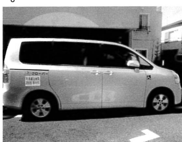
2台の車椅子が乗れます