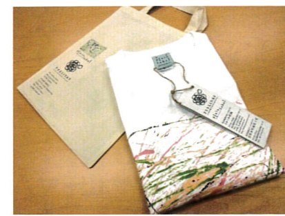
ご利用者様のデザインをカタチにします。

ルプリント』活動です。創作活動でご利用者様が描いたデザイン画を、Tシャツやエコバックに印刷し、世田谷区役所内のショップやイベント等で販売しております。また、学園祭や運動会などのイベントTシャツからスポーツチームのユニホームやタオルの制作も行っております。