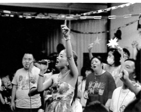
祭りの後の懇親会の様子！

この表題は、先だって開催された「第4回本町まつり」のテーマです。まつりに向けた利用者実行委員会で、「夢」「未来」「ガッツ」「宇宙」という4つのキーワードを出していたとき、それを文章にしてみました。