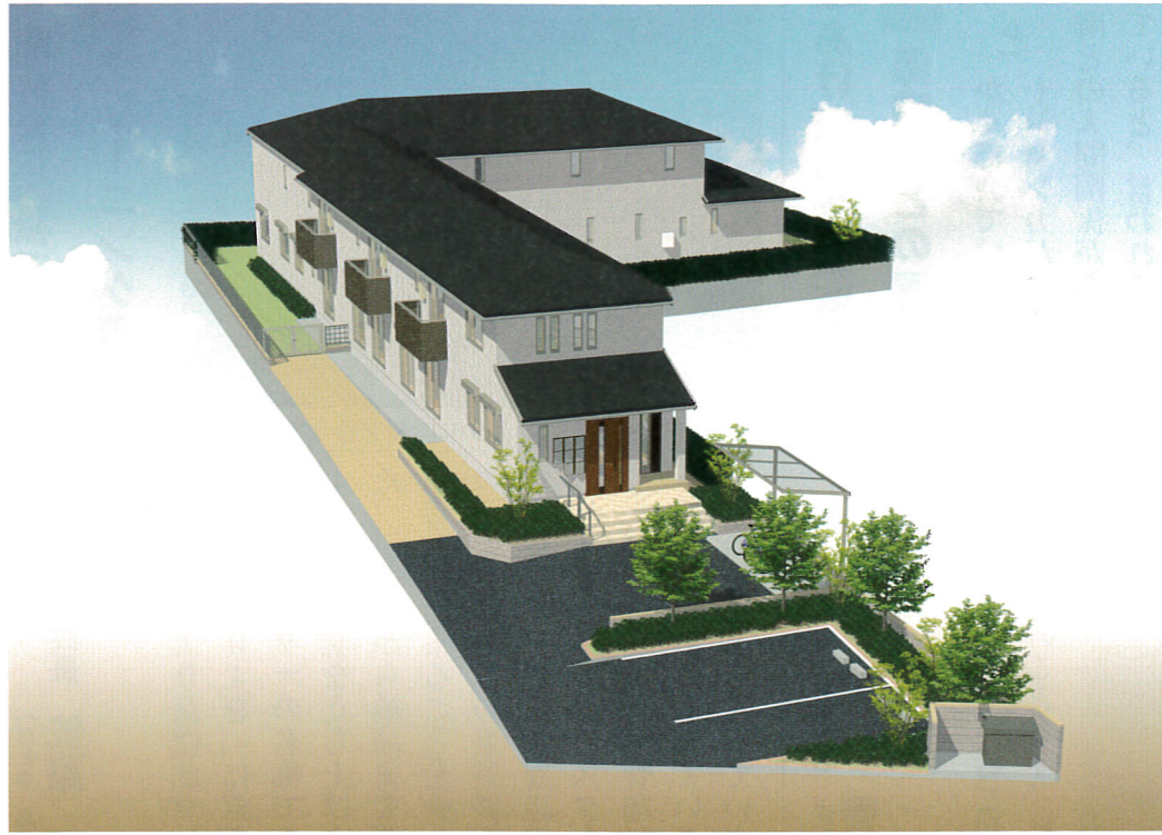
世田谷区喜多見に整備される職員寮の完成予想図。