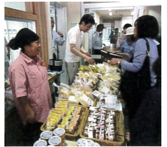
いたるセンター全体の自主生産品の紹介・販売

パン工房pukupukuでは、南荻窪の店内での販売の他、スポーツのイベント販売を含む年間でも百か所以上の外販を行っています。杉並区内の保育所や児童館の他、区役所での定期販売で安心・安全のパンをご提供しています。パン以外でいたるセンターの各施設で作られているクッキーやラスクの他、シヨクラ、タイカレーを併せてご紹介がてら販売しています。今後、パン工房pukupukuのパンを中心に、さまざまな自主生産品の外販窓口を拡げ、ご利用者様の工賃アップに努めてまいります。