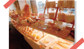
いまも人気の国産小麦・天然酵母100%のパン