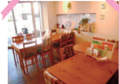
焼きたてのパンが楽しめるイートイン