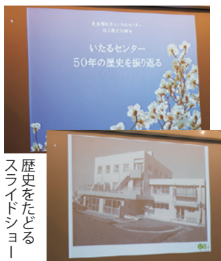
歴史をたどるスライドショー

50周年を迎えられたのは、ロマンと夢の塊のような理事長と頑張ってきた職員さんの力の賜物です。おめでとうございます。乾杯！