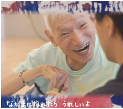
「あいするひとはすてき」MVの映像