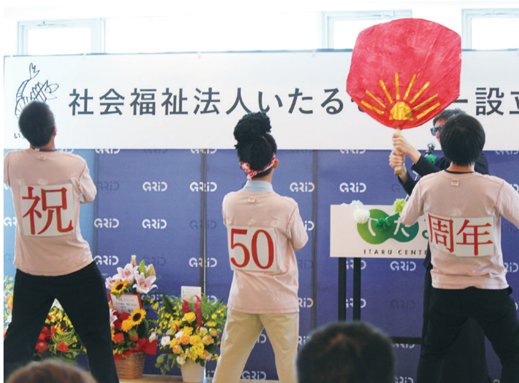
9月9日に行われた設立50周年記念イベント。みんなで祝い、楽しみました。