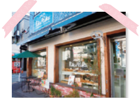
昔も今も、緑の看板が目印です