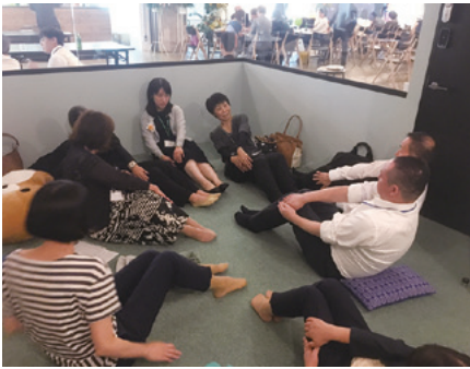
ボディトレーナーによる「自分でできる身体づくり」

50周年では、10年の表彰をいただきました。ありがとうございます。いたるセンターとの出会いは、今から40年ほど前の日本社会事業大学のサークルでボランティアに来た時でした。夏の海合宿や冬のスキー合宿、バザーの手伝い、日頃の作業の補助等学年があがるたびに、多くの時間を現在の阿佐谷福祉工房で過ごし、多くのことを利用者の方から学びました。 就職後や結婚後も時々ボランティアで参加していましたが、仕事や育児・介護が忙しくなるにつれ、疎遠になっていました。10年前に、いたる相談室を復活させたいとの依頼があり、再び利用者の方に会うことができました。またこの10年の間、家族の方や大勢の熱い思いの方々に巡り合うことができました。充実した10年だったと思います。現在はすまいる高井戸で相談支援をして6年目ですが、これからも利用者の方の思いを大切にしていきたいと思っています。