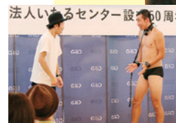
お笑いやマジックショーでみんな楽しみました。