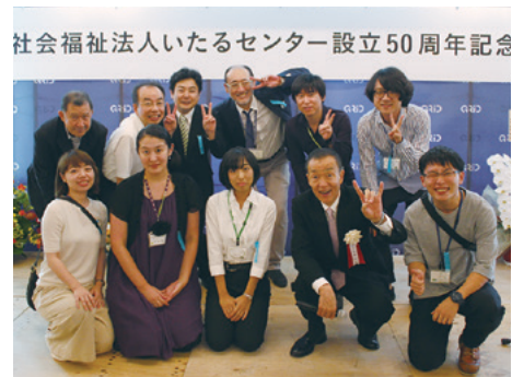
実行委員のみなさん