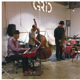
ジャズライブ、素敵でした♪