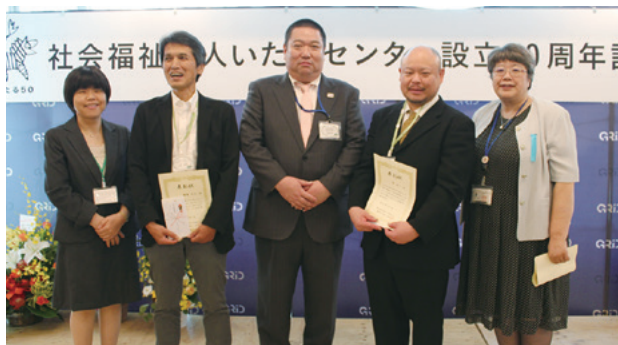
永年勤続表彰者のみなさん

第三部は永年勤続表彰で始まり、その後はマジックショーやお笑いステージ、JAZZ演奏を楽しみながら飲んで笑って、職員が主役の楽しいお祭りで幕を閉じました。