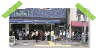
平成21年6月20日オープン時は開店時間前から行列ができました

「いたるパン」の失敗から得た教訓は、「オンリーワン」の本物のパンを作ることでした。 PukuPukuのパンは、国産小麦100%で有機天然酵母100%、塩やバターも天然で良質な素材を使用し、イーストフードや添加物は一切使用していません。 美味しいことはもちろん、自分の子供に安心して食べさせたいものを作る、オンリーワンの安全・安心へのこだわりを大切にしているからです。また、杉並区では唯一の就労継続支援A型事業であることも、オンリーワンのひとつでした。 こうして誕生したパン工房PukuPukuは、平成21年6月20日、環状8号線沿いの南荻窪に店舗を構えてスタートしたのです。 (次回「PukuPukuの新たな挑戦」をお楽しみに)