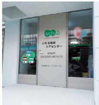
地域ケアセンター