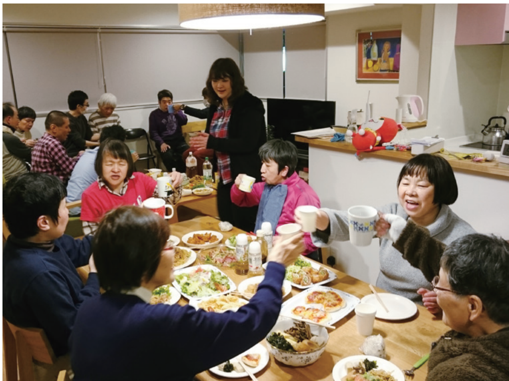
ご利用者様の重度化・高齢化対応型グループホーム「ワルツ」でのバースディパーティ。