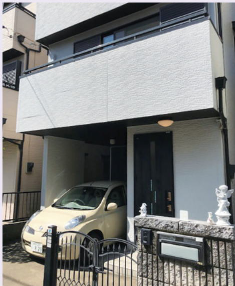
閑静な住宅街の中の一軒家が新たな拠点です

間看護部門、居宅介護支援部門を一拠点に集約させるために阿佐谷北の一軒家を賃貸し移転しました。拠点を集約することで、支援情報を一元的に管理し、共有することができ、相談業務においては正の相乗効果を生み出し、支援において