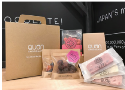
人気のチョコレートを厳選した スペシャル・アソートをお届けいたします