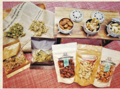
新たな自主生産品として注力している キャラメリーゼナッツです