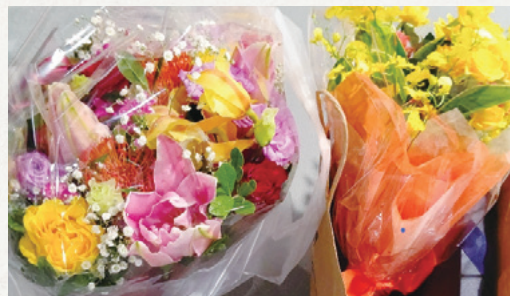
五木田施設長に贈られた花束の数々です