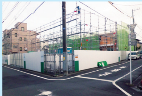
建設工事が着々と進む今川グループホーム

定員10名）、南側が女性棟（ポルカ・定員10名）となっています。このグループホームはオーナー様に建てていただき、社会福祉法人いたるセンターが30年間お借りするという建て貸し方式で契約いたします。 今後とも地域にお住まいの皆様、社会貢献をしたいという土地オーナーの皆様の協力を得て、30年間安心して住めるよう残りのグループホームについても順次建て替えを進めてまいります。